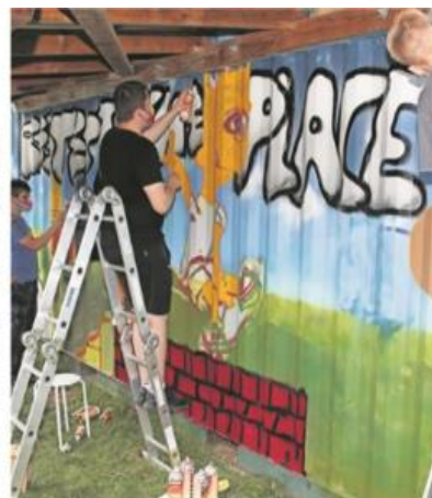
Eine Containerwand zeigt Beverstedter Motive und stellt damit einen Bezug zur Heimat der Jugendlichen her.