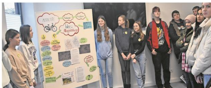
Die Jugendlichen stellen an ihrer Themenstation ihr Projekt vor. Hier geht es um Mobilität.