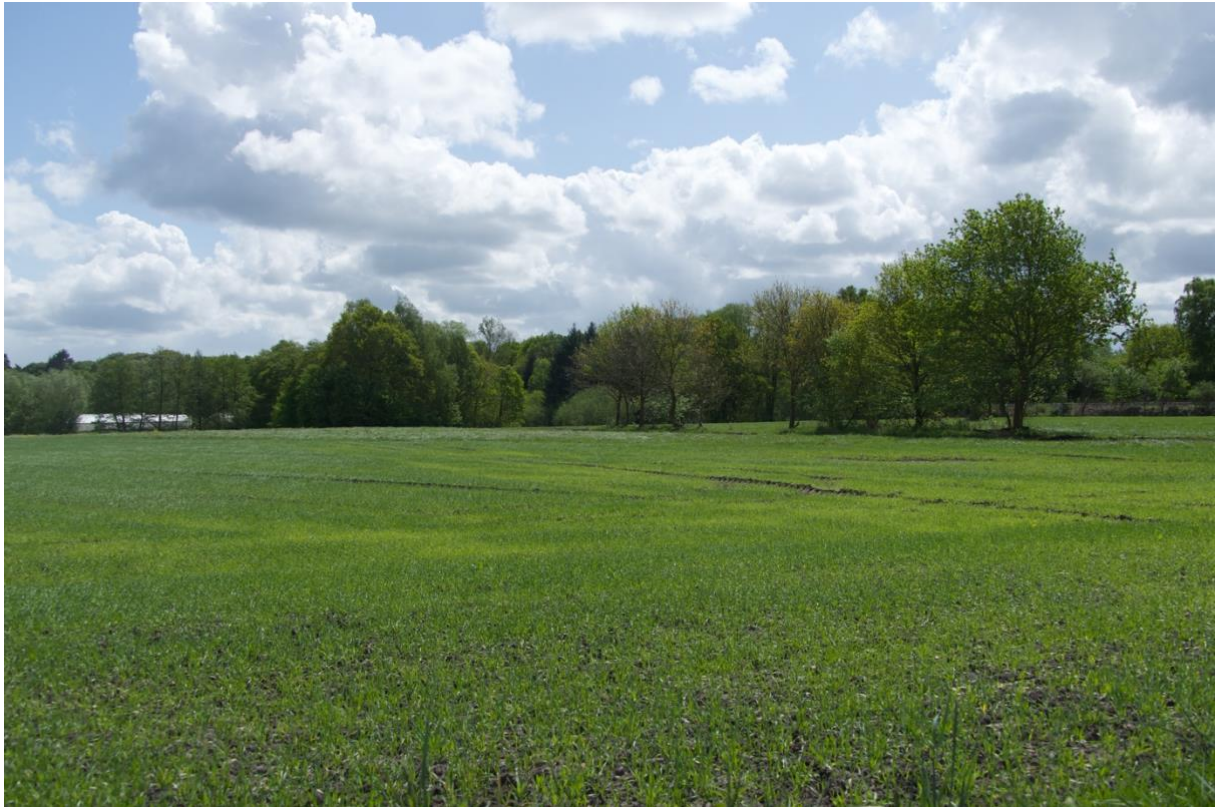
Blick in westlicher Richtung, im Hintergrund der "Frelsdorfer Mühlenbach"