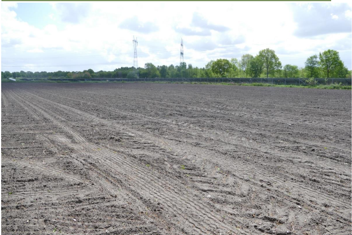
Blick in östlicher Richtung, im Hintergrund das Solarfeld (21.04.2023)