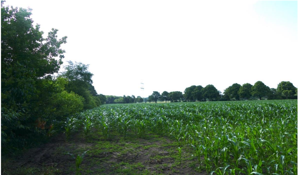
Blick in östlicher Richtung, links die Gehölzhecke an der „Löhstraße“, im Hintergrund verläuft die Landstraße