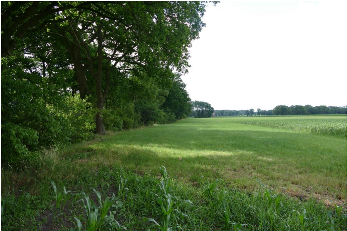
Blick in südlicher Richtung, links die Landstraße