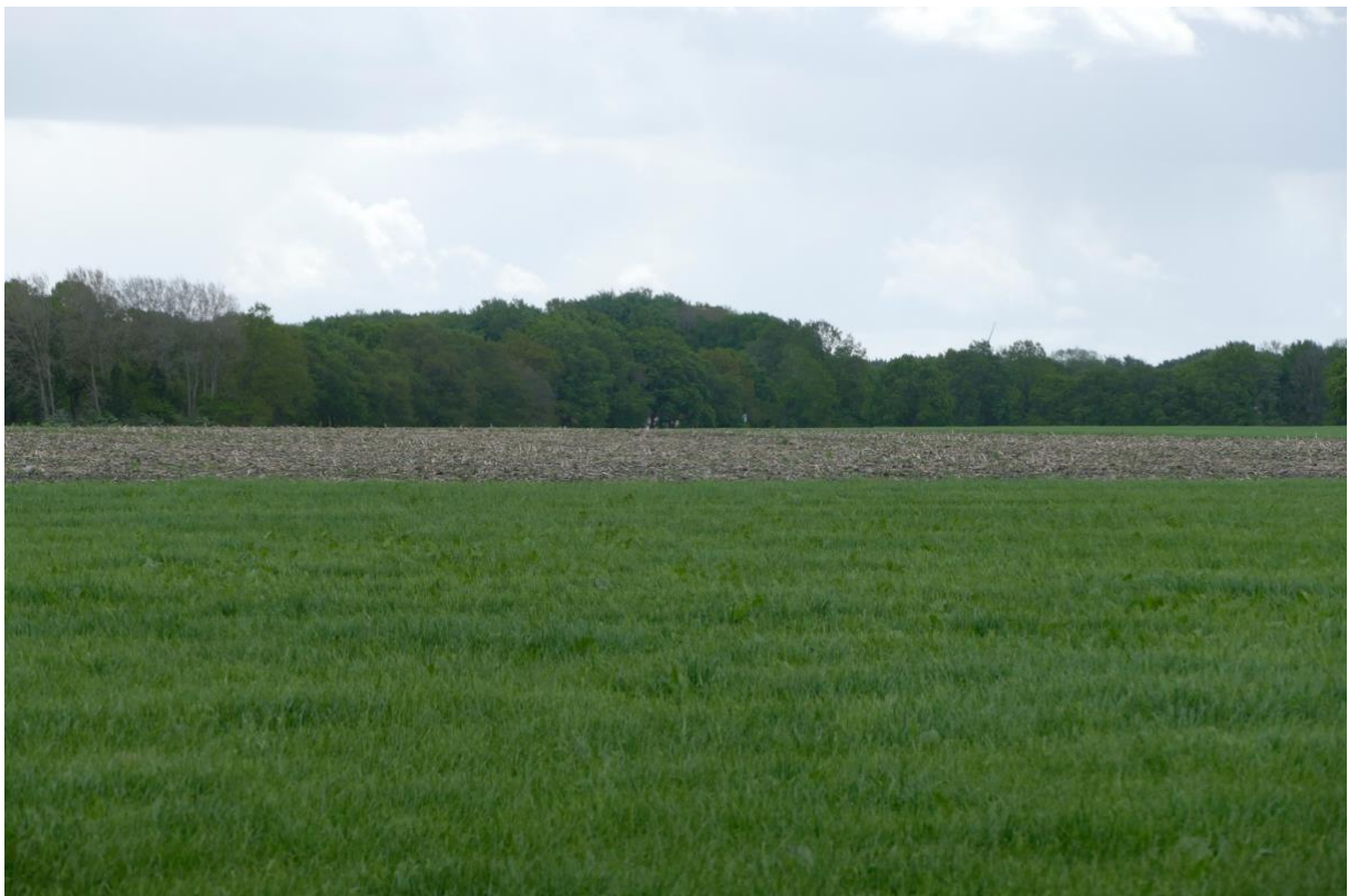
Blick in westlicher Richtung auf das Hammoor