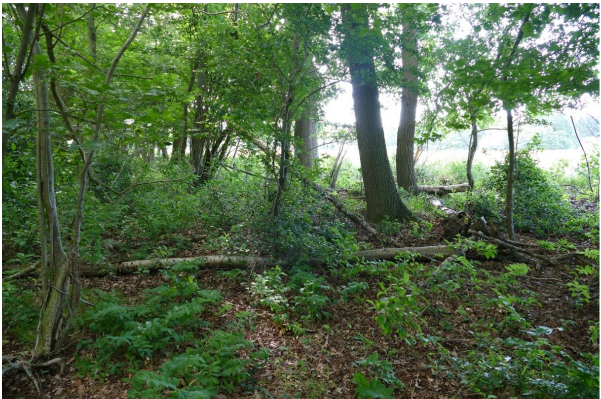
Blick in den Wald, nördlich von Fläche 5