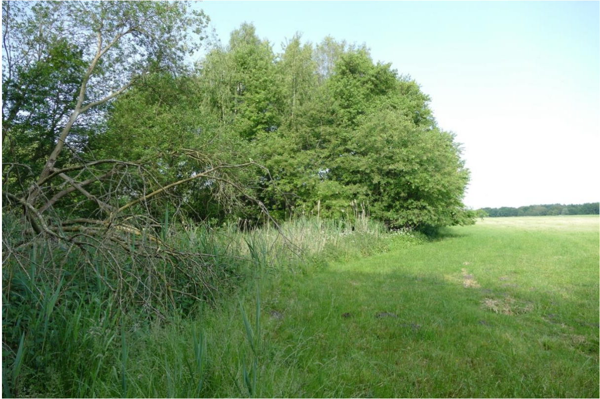
Blick in nord-westlicher Richtung, entlang eines Gehölzvorsprungs, im Hintergrund der Wald