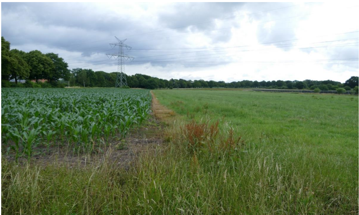
Blick in östlicher Richtung, rechts das Solarfeld, links die Landstraße (11.06.2023)