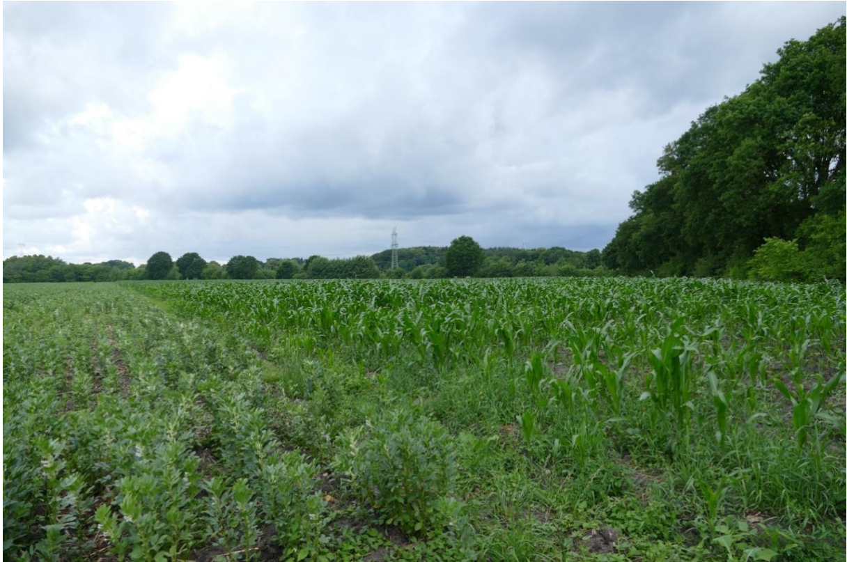
Blick in nördlicher Richtung, rechts die Landstraße, links das Hammoor