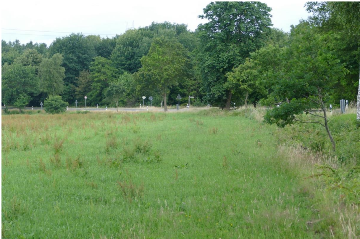
Blick in nördlicher Richtung auf die Landstraße „Geestensether - Frelsdorfer Straße“, recht die Bahnlinie