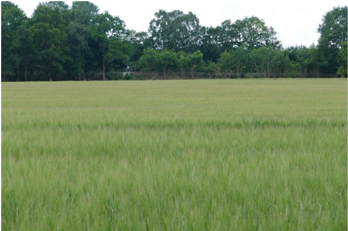
Blick über das Getreidefeld in südlicher Richtung, im Hintergrund die Bahnlinie, dazwischen eine Mähwiese