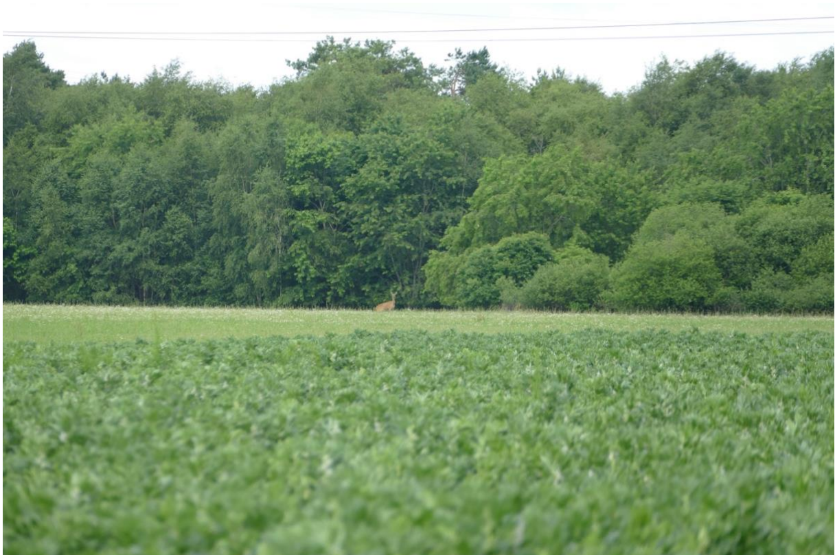
Blick in westlicher Richtung auf das Hammoor