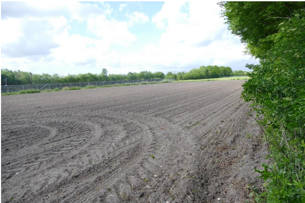
Blick in westlicher Richtung auf das UG, rechts das bestehende Solarfeld