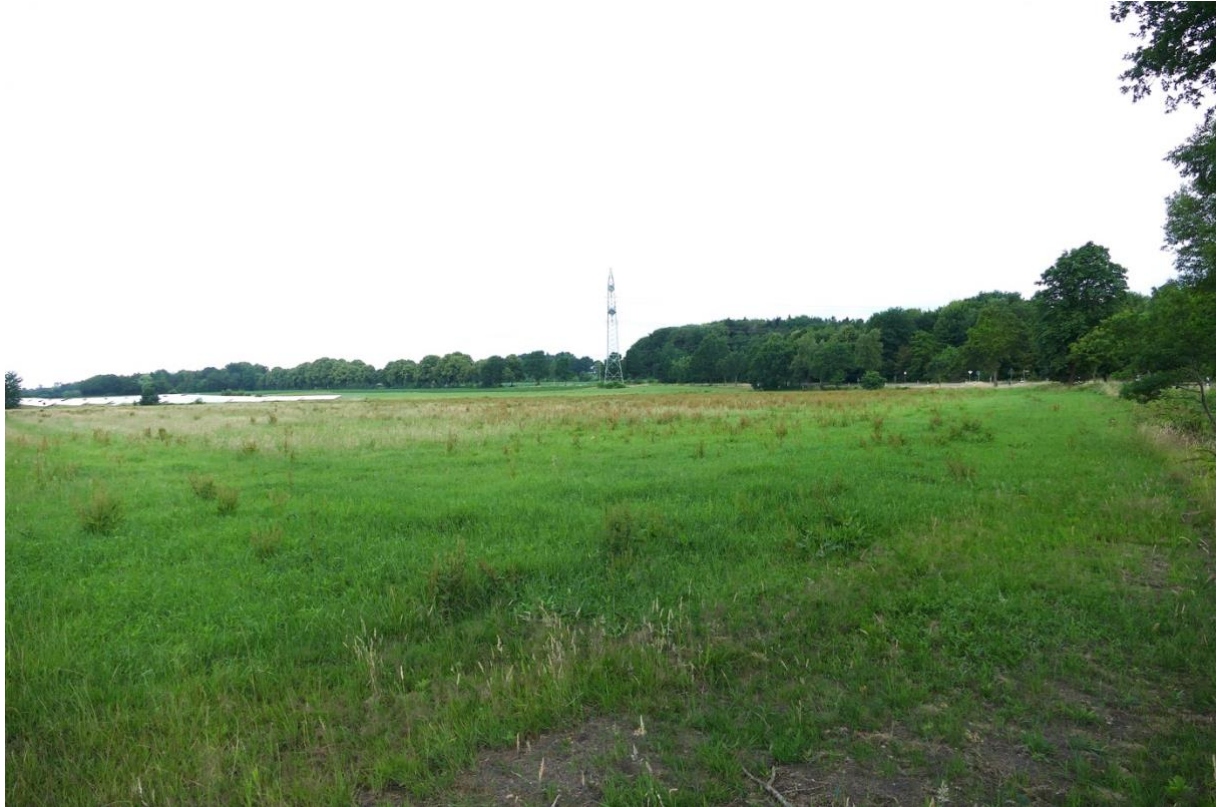
Blick in nord-westlicher Richtung, links das Solarfeld, rechts die Landstraße, im Hintergrund Fläche 2