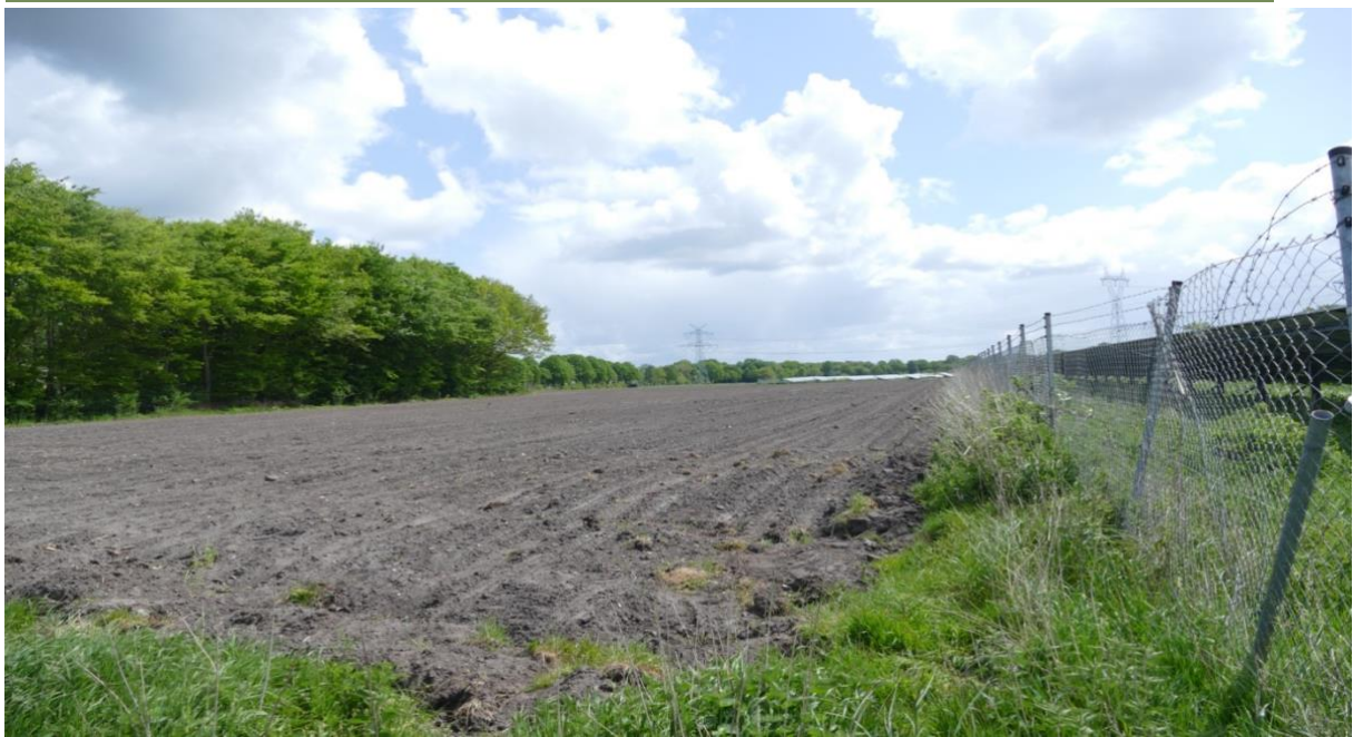
Blick in östlicher Richtung, rechts das bestehende Solarfeld, links eine Wohnbebauung