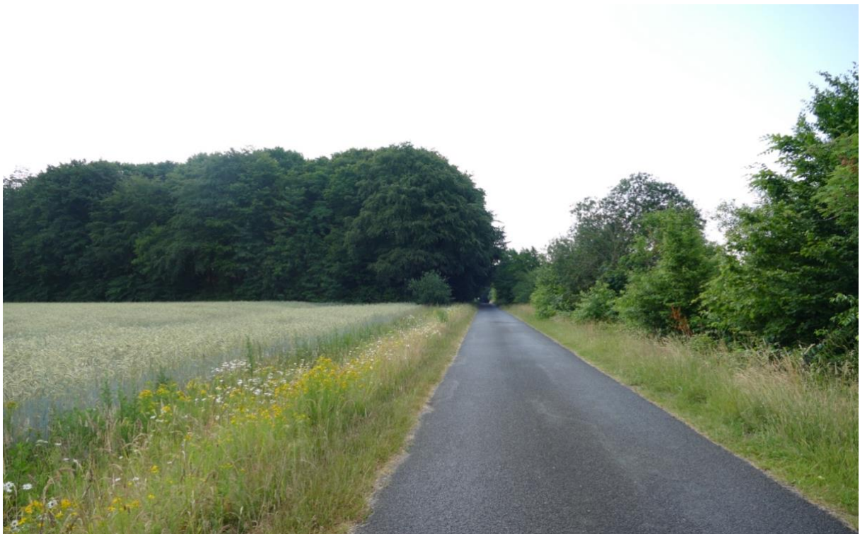
Die „Löhstraße“ in östlicher Richtung, links der Wald mit dem Einfamilienhaus, rechts das UG