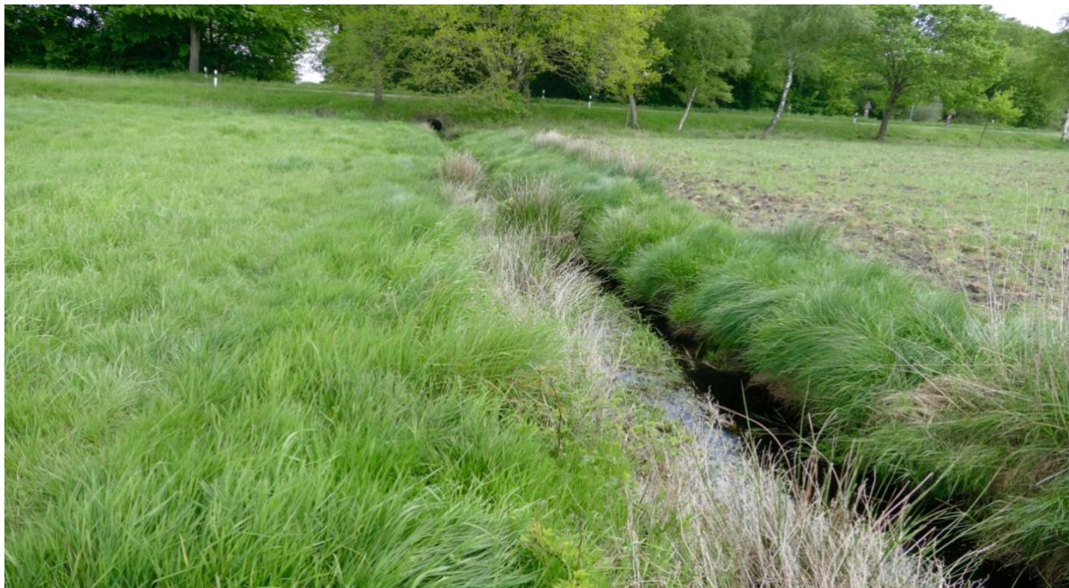
Blick in nördlicher Richtung auf den "Hammoorgraben", links Fläche 2 und rechts Fläche 3, im Hintergrund die Landstraße