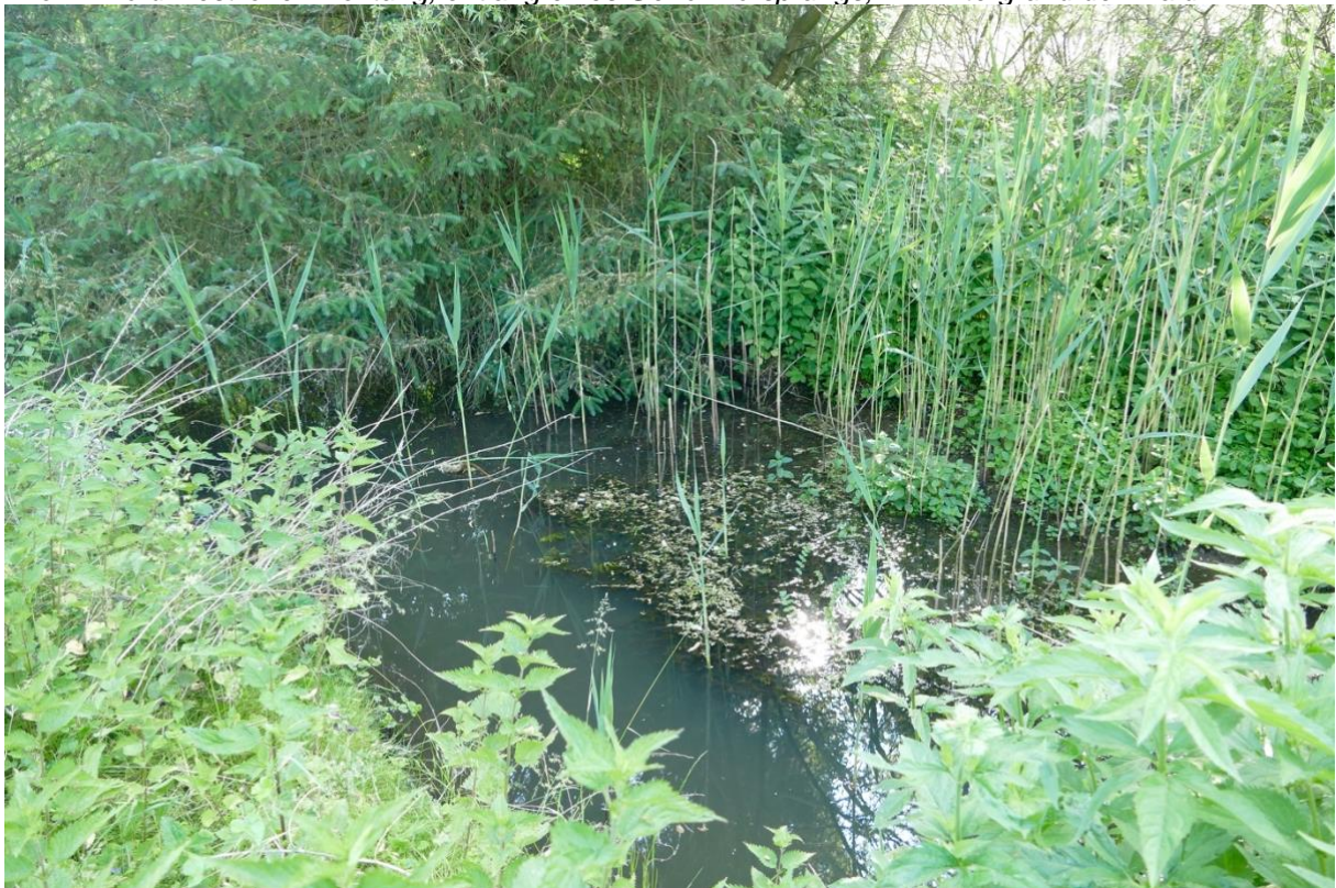
Der Frelsdorfer Mühlenbach