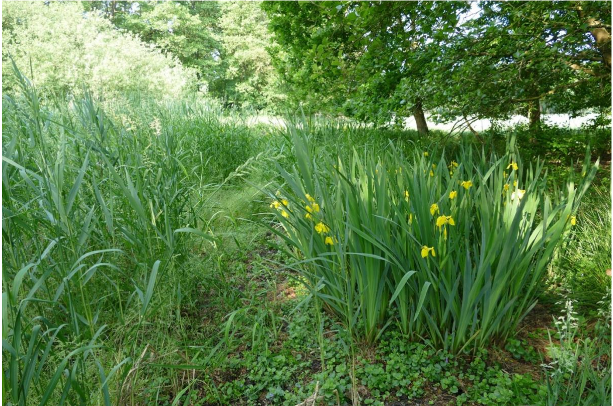
Am Frelsdorfer Mühlenbach