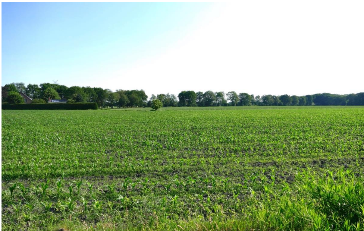
Blick auf den Maisacker in nördlicher Richtung, im Hintergrund der „Frelsdorfer Mühlenweg“, links ein landwirtschaftlicher Betrieb